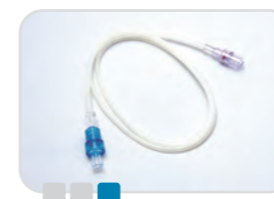
Art. No. 31 5124-000 HS 224/180 RA Línea de paciente con válvula