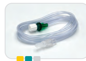
Art. No. 31 8301-100 Línea de paciente 300 cm con válvula