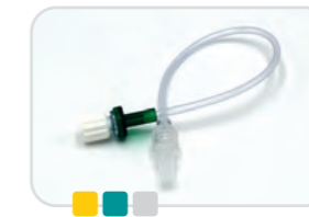
Art. No. 31 8020-100 ES 224/25 Línea de paciente con válvula