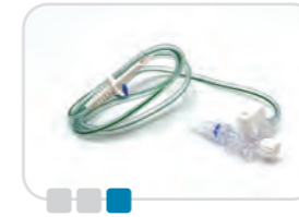
Art. No. 31 5081-100 Tubo de succión HSD 525