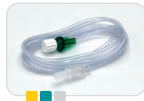
Art. No. 31 8152-100 Línea de paciente 150 cm con válvula de retención