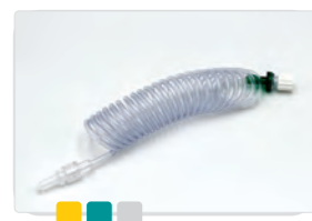
Art. No. 31 8181-100 Línea en espiral de 180 cm con válvula de retención