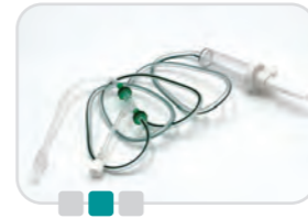
Art. No. 31 7081-100 EK 223 Sistema de tubos con cámara de goteo