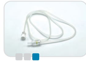
Art. No. 31 5136-000 HS 224/150 RA Línea de paciente