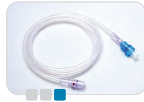
Art. No. 31 5137-000 HP 120 RA Línea de paciente con válvula de retención, PVC-flex