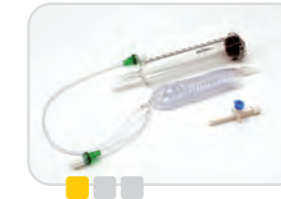
Art. No. 31 7604-000 MR Set ELS* 65 ml