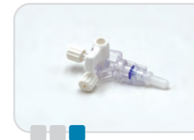
Art. No. 31 5087-100 HDW 526 alta presión Llave de paso de 3 vías