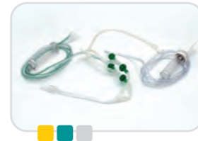
Art. No. 31 7099-100 Sistema de tubos MRS 222 RM con 1 cámara de goteo en línea