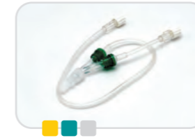
Art. No. 31 7125-100 Sistema de tubos MRS 225 MR