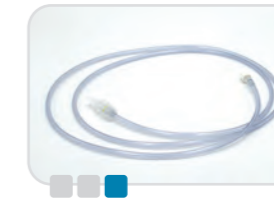
Art. No. 31 5130-000 HP 120 RA Línea de paciente, PVC-flex