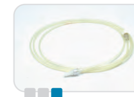
Art. No. 31 5134-000 HS 224/180 Línea de paciente