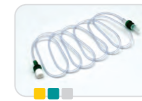
Art. No. 31 8026-100 Línea de paciente 150 cm con válvulas de retención en terminal