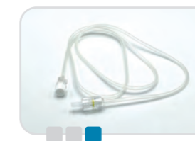
Art. No. 31 5135-000 HS 224/180 RA Línea de paciente

● Inyectores de doble cabezal para resonancia magnética (21 bar/305 psi) ● Inyectores de alta presión para angiografía (83 bar/1.200 psi)