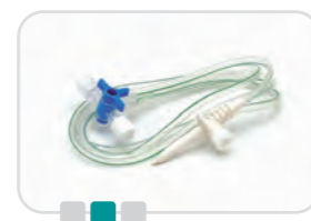
Art. No. 31 9080-100 SD 225 tubo de succión con llave de paso de tres vías y espiga

● Inyectores de doble cabezal para resonancia magnética (21 bar/305 psi) ● Inyectores de alta presión para angiografía (83 bar/1.200 psi)