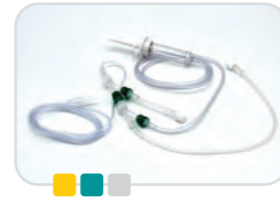
Art. No. 31 7083-100 Sistema de tubos con línea de succión y cámara de goteo