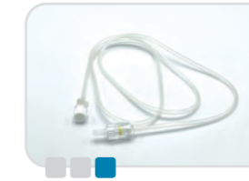
Art. No. 31 5125-000 HS 224/120 Línea de paciente