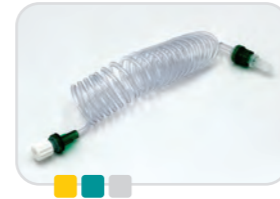
Art. No. 31 8217-000 Línea en espiral de 150 cm con 2 válvulas de retención