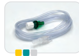
Art. No. 31 8251-100 Línea de paciente 250 cm con válvula