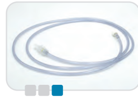
Art. No. 31 5138-000 HP 150 RA Línea de paciente, PVC-flex