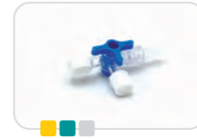
Art. No. 31 9085-100 Llave de paso de tres vías