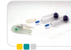
Art. No. 31 7625-000 CT2/MRT Set ELS*