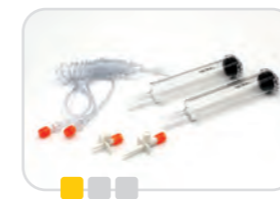
Art. No. 31 7602-000 MR-Set ELS* 65 ml