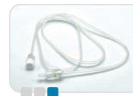
Art. No. 31 5100-000 HS 224/100 RA Línea de paciente