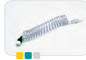
Art. No. 31 8214-000 Línea en espiral de 150 cm con válvula de retención