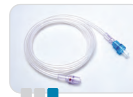
Art. No. 31 5121-000 HP 150 RA Línea de paciente con válvula de retención, PVC-flex