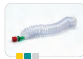
Art. No. 31 8253-000 Línea en espiral de 250 cm con válvula de retención