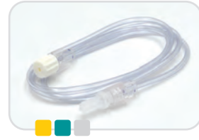
Art. No. 31 8101-100 ES 224/100 Línea de paciente