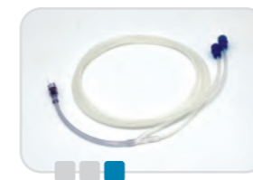
Art. No. 31 7188-000 Accutron® HP-D - Conector en Y 83 bar con 2 CV y RA - suministro largo