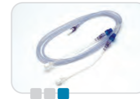
Art. No. 31 7187-000 Accutron® HP-D - Línea de presión en Y con 2 válvulas de retención