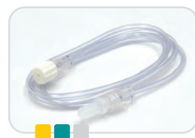
Art. No. 31 8199-100 ES 224/200 Línea de paciente