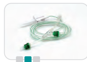
Art. No. 31 7080-100 ES 223 Sistema de tubos on espiga