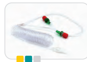
Art. No. 31 7104-000 MR-ELS* Sistema de tubos con 2 válvulas, verde