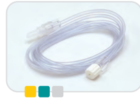
Art. No. 31 8151-100 ES 224/150 Línea de paciente