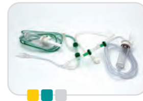
Art. No. 31 7100-100 MRS 222 Sistema de tubos RM