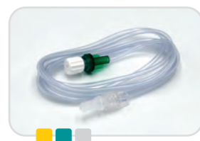
Art. No. 31 8198-100 Línea de paciente 200 cm con válvula