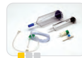
Art. No. 31 7603-000 MR-Set 65/200 ml