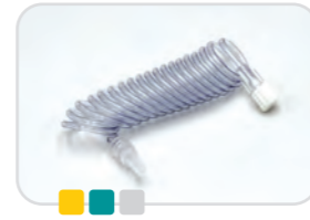
Art. No. 31 8213-000 Línea en espiral de 150 cm