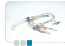
Art. No. 31 7184-000 Sistema de tubos Scanbag® HP-D