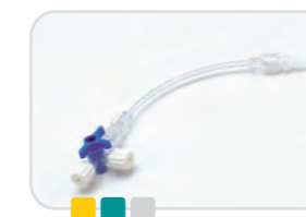
Art. No. 31 8042-100 DW 229 Conector con llave de paso de tres vías