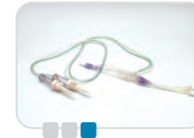
Art. No. 31 7183-000 Sistema de tubos Accutron® HP-D