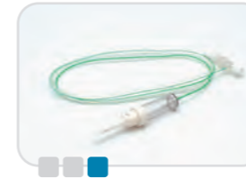
Art. No. 31 5082-000 Tubo de succión HSD 527 con válvula