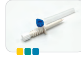
Art. No. 31 9095-100 SP 227 espiga ventilada, cerradura Luer