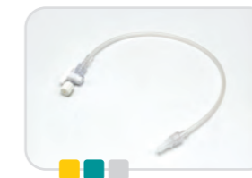
Art. No. 31 8025-100 Llave de paso unidireccional con línea de extensión 30 cm, cerradura Luer