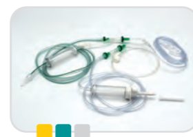
Art. No. 31 7109-100 Sistema de tubos de doble cabezal con 1 cámara de goteo en línea