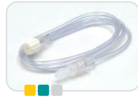
Art. No. 31 8081-100 ES 224/80 Línea de paciente