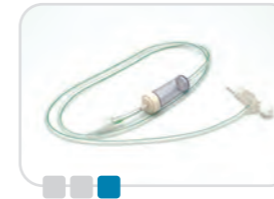
Art. No. 31 5083-000 Tubo de succión HSD 527 con válvula y cámara de goteo en línea