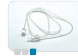
Art. No. 31 5126-000 HS 224/120 RA Línea de paciente