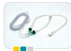
Art. No. 31 7101-100 Sistema de tubo de doble cabezal