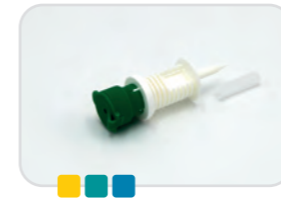
Art. No. 31 9099-100 DW 226 mini espiga, verde, cerradura Luer