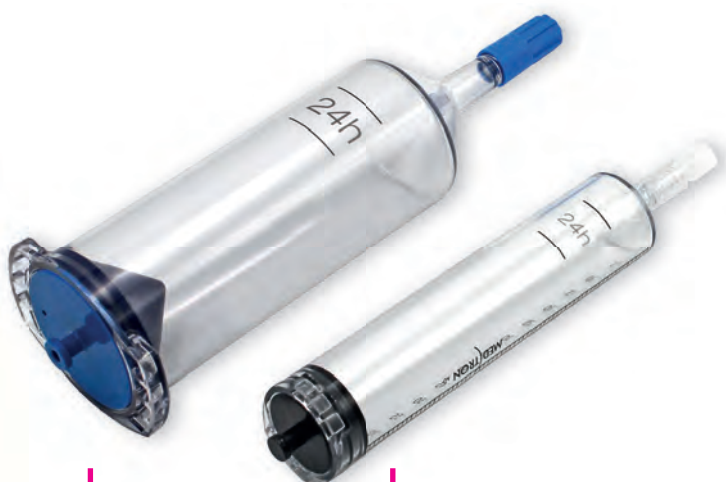
Day Safe Jeringa 200 ml Art. 312426-100