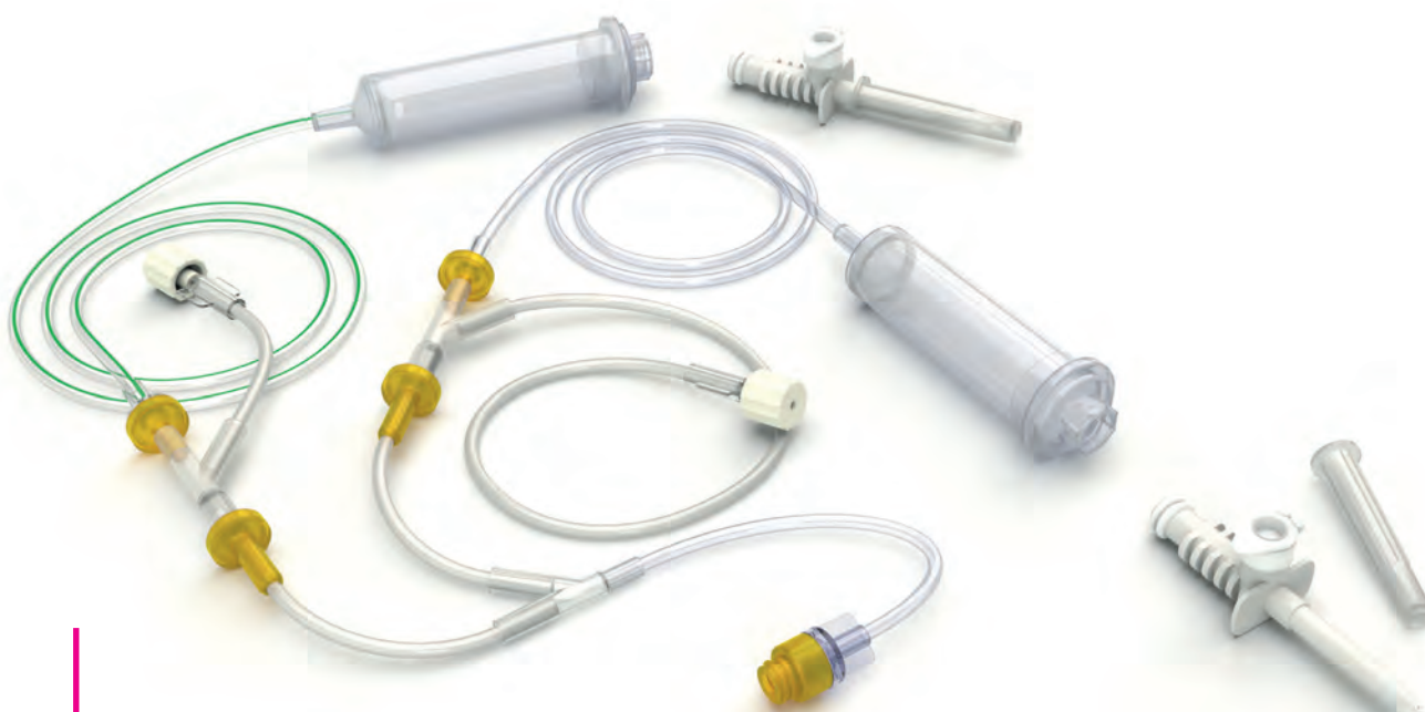
Day Safe Tubo de Llenado D Art. 312400-100