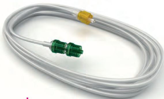
SUre Línea de Paciente Art. 318415-100