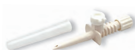
Spike Art. 314095-100